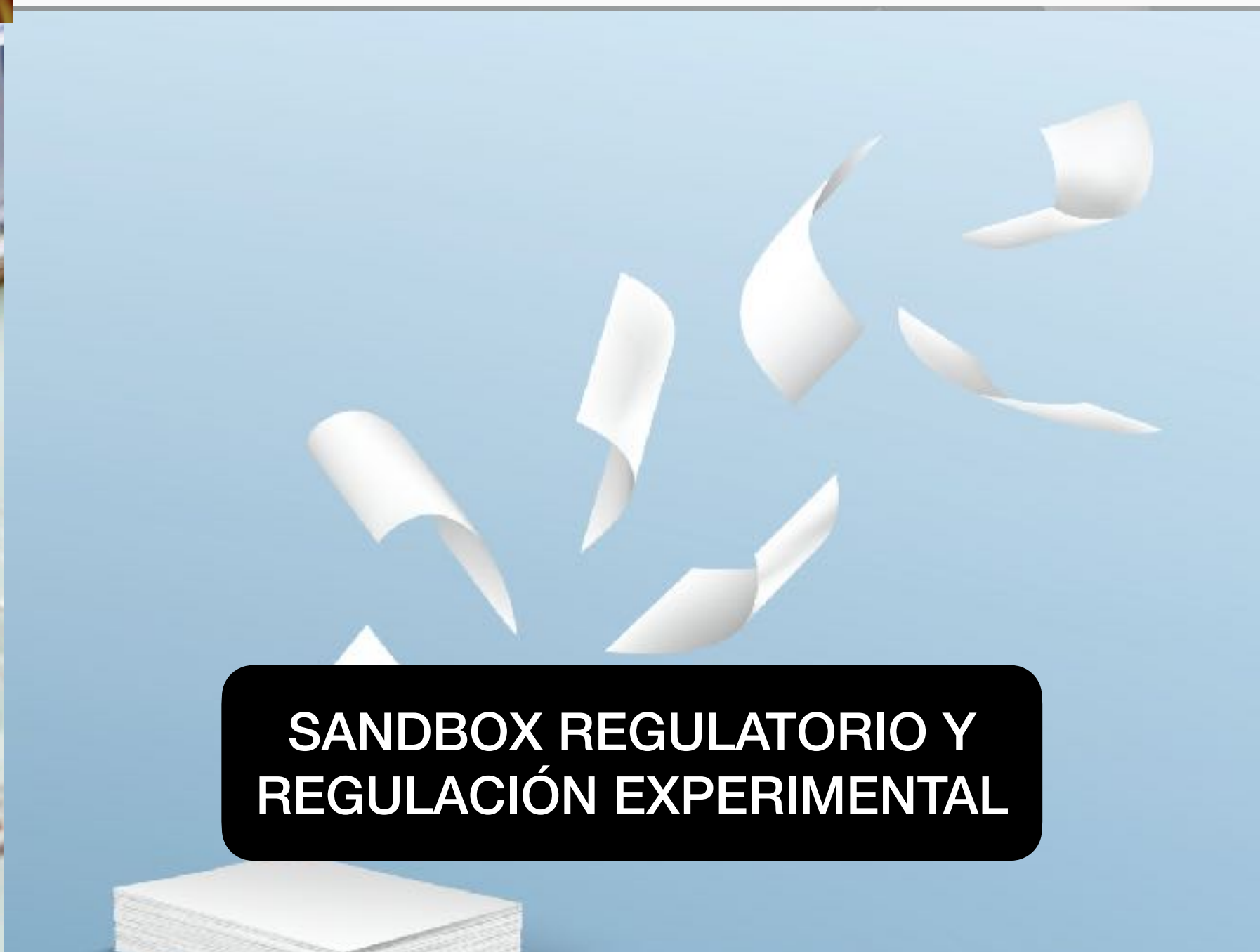
SANDBOX REGULATORIO Y REGULACIÓN EXPERIMENTAL