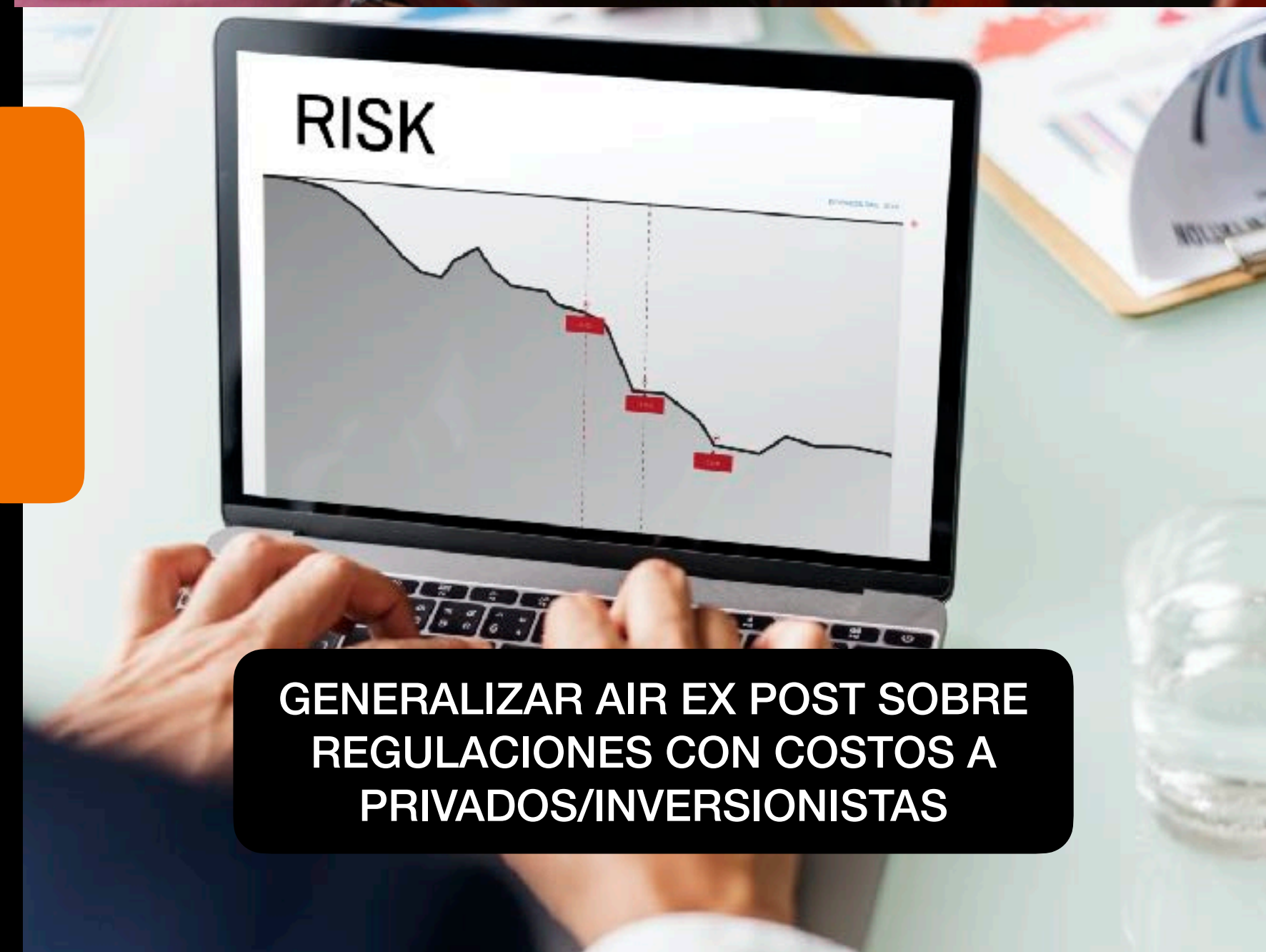
GENERALIZAR AIR EX POST SOBRE REGULACIONES CON COSTOS A PRIVADOS/INVERSIONISTAS