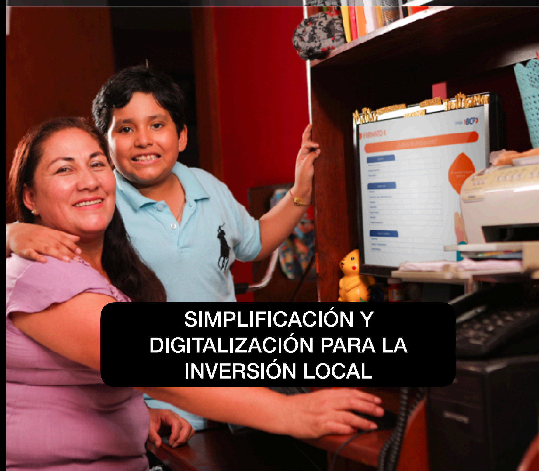
SIMPLIFICACIÓN Y DIGITALIZACIÓN PARA LA INVERSIÓN LOCAL